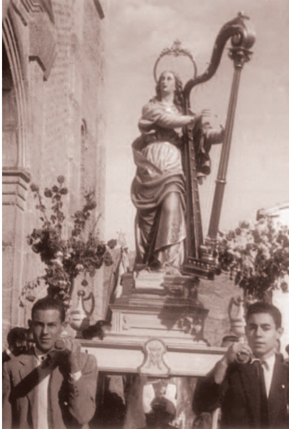
1950. Salida de la procesión de Santa Cecilia.

"Orfeu pot encapçalar la raça salvatge; i els arbres desarrelats desaparèixer d'on estan, seques de la lira: però la radiant Cecília va obrar un gran miracle: quan el seu òrgan vocal va rebre l'alé, un àngel la va sentir, i va aparèixer confonent el cel amb la terra" (Song for St. Cecilia's Day, 1987, John Dryden).