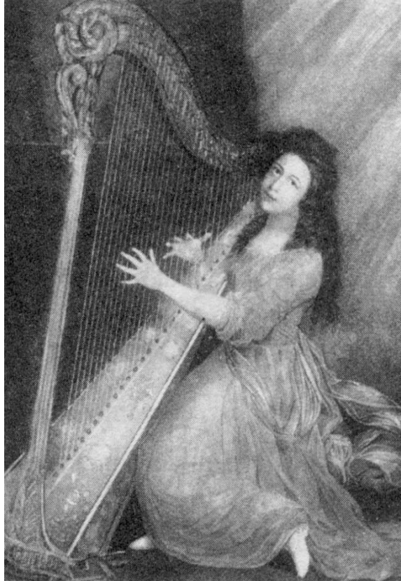
Santa Cecília, patrona dels músics, representada per William Bond (segle XVIII)

"Bendita Cecilia, s'apareix en somnis a tots els músics, s'apareix i els inspira: filla convertida descendeix i enxisa els compositors mortals amb el foc immortal".